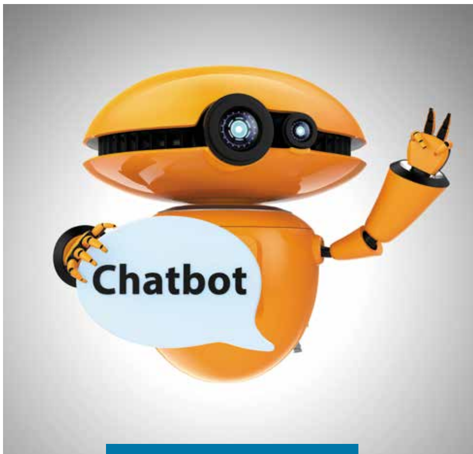
Chatbots, wie die digitalen Assistenten, steigern die Effizienz in der Immobilienbranche und unterstützen die Mitarbeiter.

Dann ist ein Chatbot, der Ihre Interessenten berät, sicher hilfreich für Sie. Mietinteressierte können Ihren Chatbot